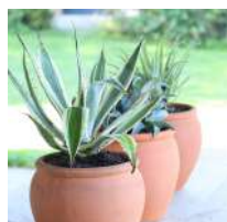
POT DE JARDIN