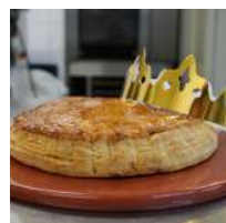
PLAQUE A FOUR